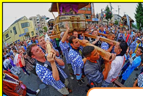
第64回 入選作品 「日本文化に熱中」