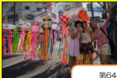
第64回 最優秀賞作品 「竹飾りを背景に」